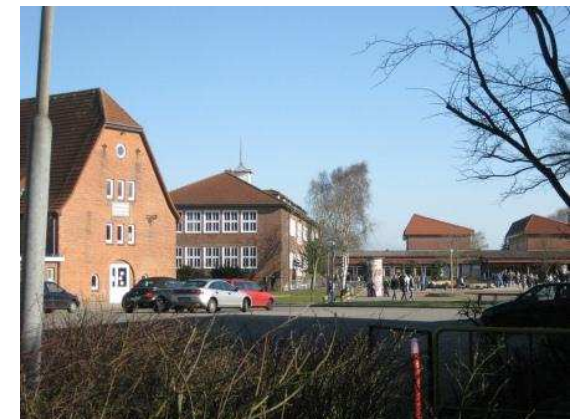
Quellen: inspektour GmbH, 2012